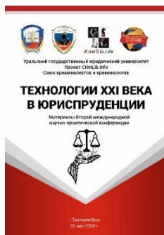
Сборник конференции 2020 г.

Доклады принимаются до 23:59 (GMT+5) 17 мая 2021 года.